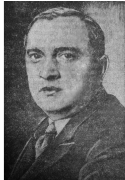
Фото з газети “Вільна Україна” за 13 червня 1941 р.

Радянська влада залучала С. Банаха до політичної діяльності: участі у різних зборах, підпису листів до керівників держави, публікацію статей у газетах. У грудні 1940 р. його обирають депутатом міської ради Львова. У березні 1941 р. ВАК СРСР надав Банахові ступінь доктора фізико-математичних наук і звання професора. У червні він був включений у список кандидатів до обрання членом-кореспондентом АН УРСР. Початок війни 1941 р. застав С. Банаха у Києві. Останнім поїздом він зміг повернутись до Львова. У часи німецької окупації Банах разом з сином і з багатьма львівськими вченими працював донором при виготовленні протитифозної вакцини у бактеріологічному інституті професора Р. Вайгля. Ця праця давала йому засоби для існування.