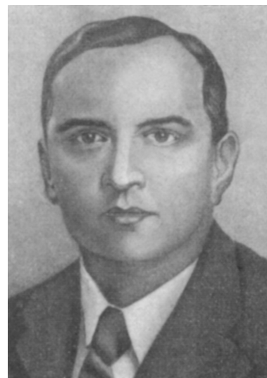
фото з книги “Курс функціонального аналізу”